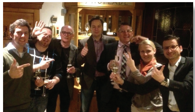
Plus zwei Mandate für die St.Georgener VP & Unabhängigen bei der Gemeinderatswahl 2015.