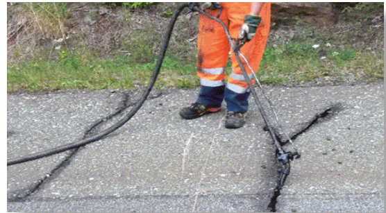
Rissanierungen sind für ein gepflegtes Ortsbild unbedingt notwendig